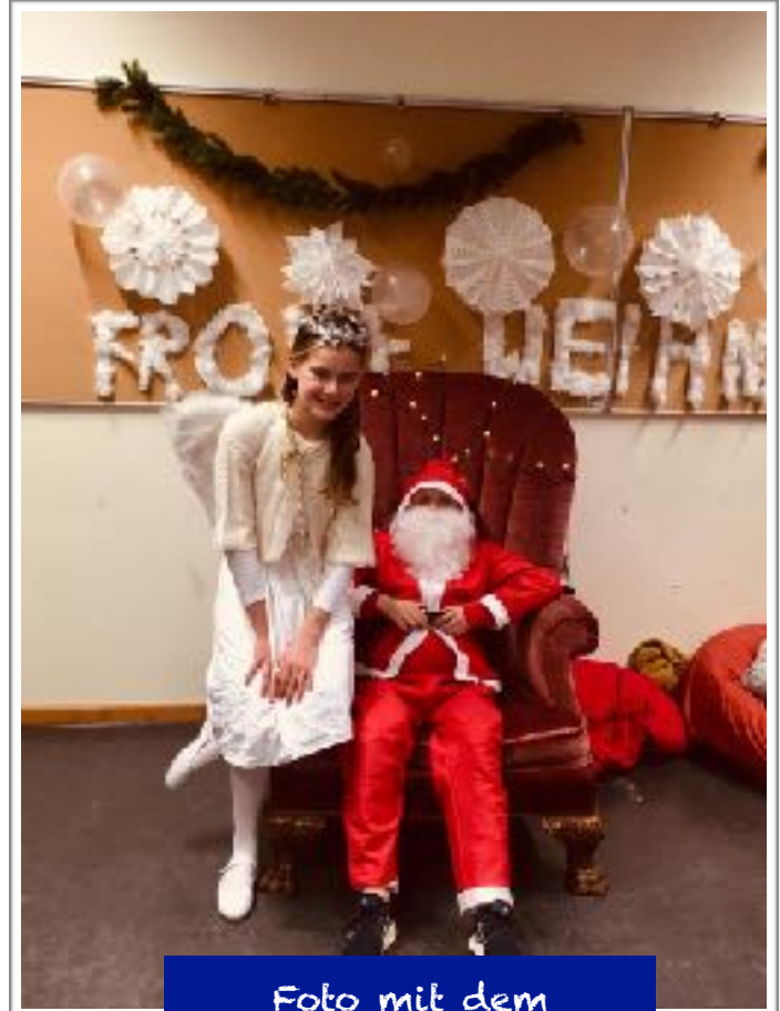
Foto mit dem Weihnachtsmann