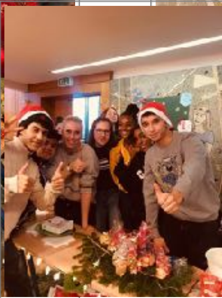
Süßes war auch dabei!