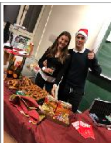
Vom Mathe LK: Casino mit Bar